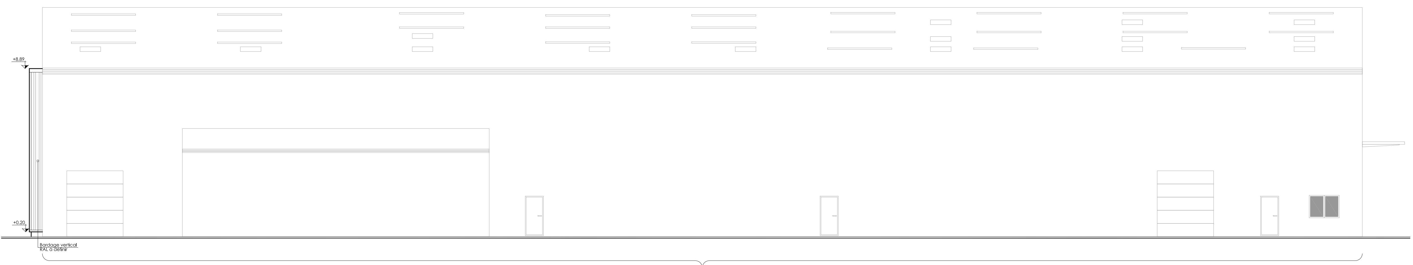
- Façade Est - Ech : 1/100

Niveau de référence ±0.00 = identique à l'existant